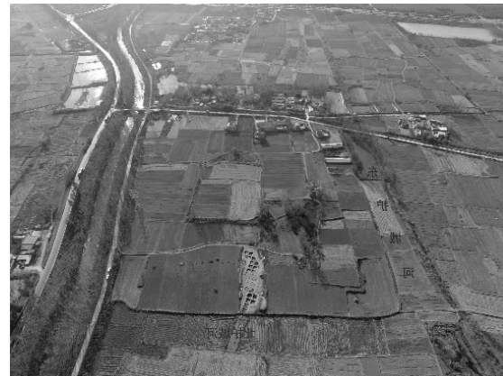
西南小城遗址2021年度发掘现场航拍照