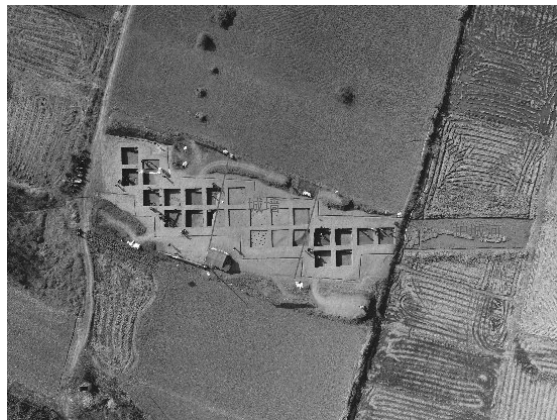
西南小城遗址航拍照