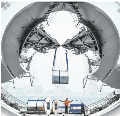
工韵双轴谱