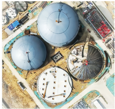
圆顶筑梦人 刘晓明 摄