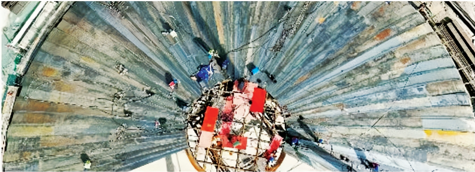
高空织网者