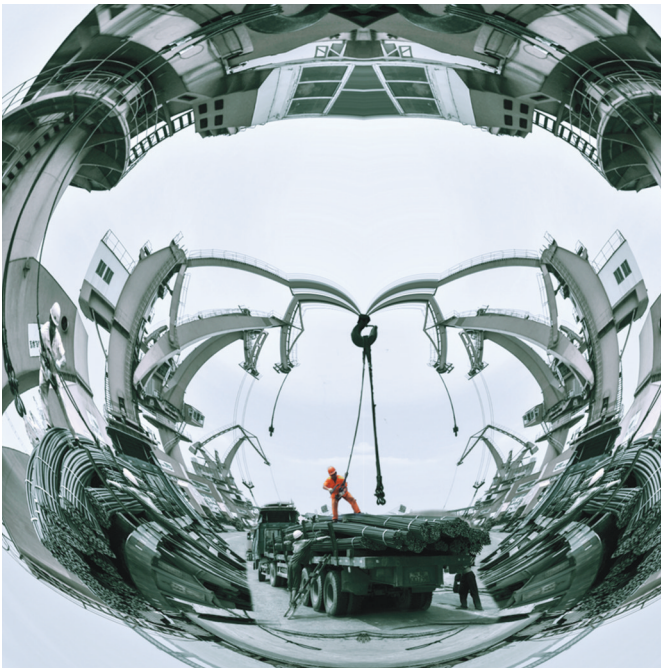
钢筋凌云渡