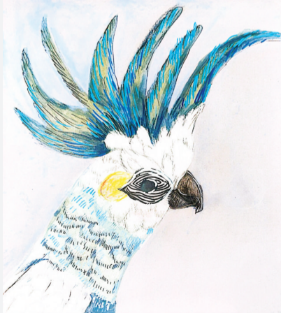
泉山湖中学 五(8)班 殷弘毅