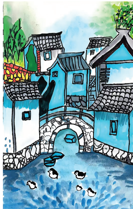
田家庵区第十六小学 二(10)班 陆昊双