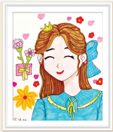
淮师附小山南校区 三(16)班 方沐瑶