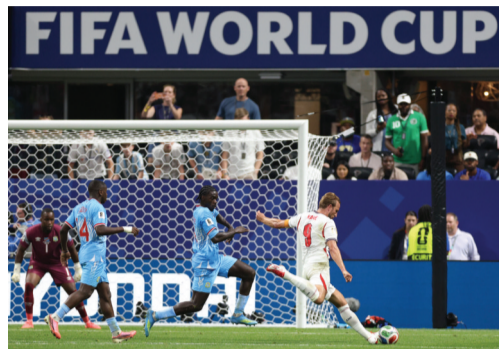
7月1日,英格兰队球员哈里·凯恩(右一)在比赛中射门得分。

新华社美国亚特兰大7月1日电 在1日进行的三场美加墨世界杯32强赛中,英格兰队、比利时队均上演绝境逆转的好戏,分别淘汰刚果(金)队和塞内加尔队;美国队则在下半场少一人的情况下击败波黑队,晋级16强。