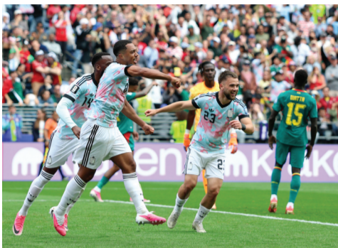
7月1日,比利时队球员蒂莱曼斯(左二)进球后庆祝。