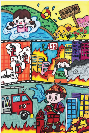
田家庵区第十八小学 二(4)班 陈妙童

作为新时代的少先队员,我深深明白:我们如今的幸福生活,都是革命先辈用热血和生命换来的。今后,我会铭记历史、珍惜当下,认真学习,用实际行动传承英烈精神,努力争做新时代的优秀少先队员!