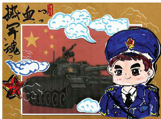
洞山中学 三(9)班 詹和泽